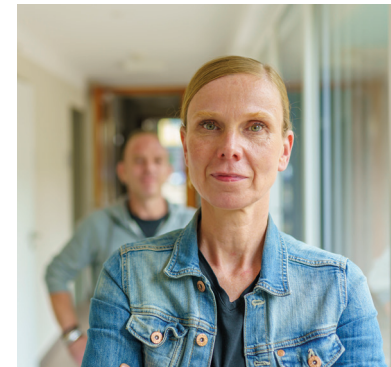
Stand: 7.6.2022, Entwurf: DW-Region-Kassel; Miriam Abele